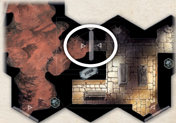
Diese beiden Felder sind benachbart, da sie über ihre grauen Grenzen miteinander verbunden sind und diese aneinander ausgerichtet sind (die beiden Pfeile zeigen genau aufeinander).

Falls zwei Felder durch schwarze Grenzen voneinander getrennt sind und ihre grauen Grenzen nicht aneinander ausgerichtet sind (mit anderen Worten, wenn eine graue Grenze auf eine schwarze Grenze trifft), sind diese Felder nicht benachbart zueinander.