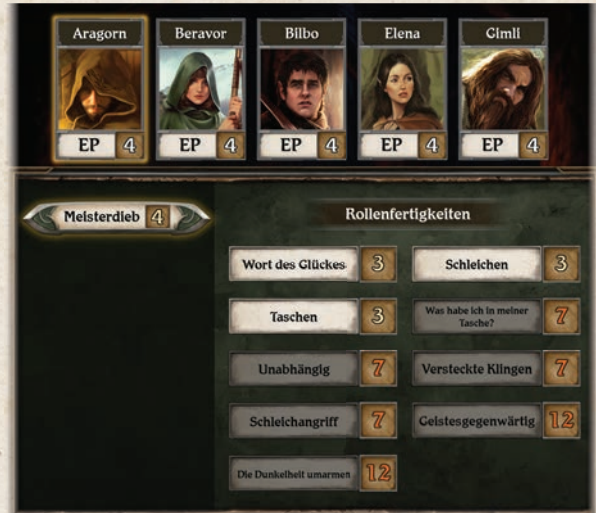
Aragorn hat in seiner Rolle als Meisterdieb 4 Erfahrungspunkte. Er hat bereits „Wort des Glückes“, weshalb er sich von den verfügbaren Meisterdieb-Fertigkeiten entweder „Schleichen“ oder „Taschen“ kaufen kann.

Ihr könnt eure Helden in der App auswählen, um ein Menü zu öffnen, in dem die Erfahrung eines Helden nach den jeweiligen Rollen sortiert ist. Wählt ihr eine Rolle aus, wird das Menü erweitert und es werden alle Fertigkeitenkarten angezeigt, die zu dieser Rolle gehören. Fertigkeitenkarten, die ein Held bereits besitzt, werden grün angezeigt, Fertigkeitenkarten, die zu teuer sind, werden rot dargestellt und Fertigkeitenkarten, die nicht verfügbar sind, weil sie schon ein anderer Held besitzt, werden ebenfalls rot angezeigt und zeigen das Porträt des Helden, der die Fertigkeit besitzt. Fertigkeitenkarten, die weder rot noch grün angezeigt werden, sind