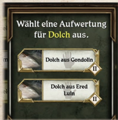
Mit 25 Wissen kann der „Dolch“ aufgewertet werden. Für ihn stehen die Aufwertungen „Dolch aus den Ered Luin“ und „Dolch aus Gondolin“ zur Verfügung.

Sobald ihr einen hervorgehobenen Gegenstand aus dem Gegenstands-menü auswählt, werden alle verfügbaren Aufwertungen für diesen Gegenstand angezeigt. Um den Gegenstand aufzuwerten, wählt ihr die aufgewertete Version des Gegenstands in der App aus. Anschließend erhält der Held die Karte, die der Aufwertung entspricht, und legt die vorherige Version des aufgewerteten Gegenstandes zurück in den Vorrat.