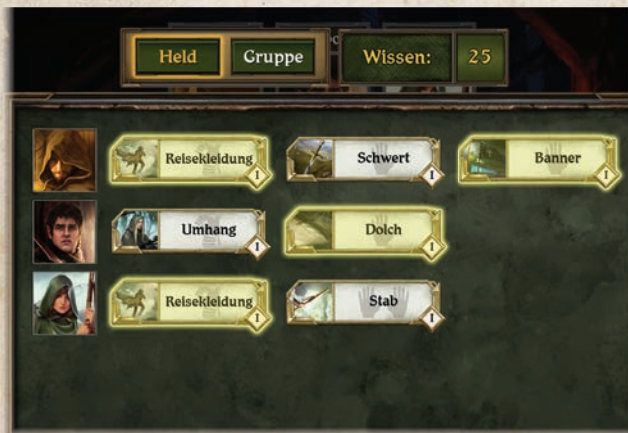
Die Helden haben genug Wissen, um alle hervorgehobenen Gegenstände aufzuwerten.

Sobald ihr einen hervorgehobenen Gegenstand aus dem Gegenstands-menü auswählt, werden alle verfügbaren Aufwertungen für diesen Gegenstand angezeigt. Um den Gegenstand aufzuwerten, wählt ihr die aufgewertete Version des Gegenstands in der App aus. Anschließend erhält der Held die Karte, die der Aufwertung entspricht, und legt die vorherige Version des aufgewerteten Gegenstandes zurück in den Vorrat.